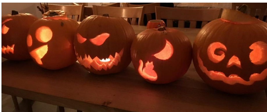
Resultat av gresskarskjæring for fastboende og stab.

Kanskje kan vi bli flinkare til å sjå på dei fine haustfargane med eit blick for dei som har eit ekstra behov for varme og omtanke i denne tida. Og kanskje skal vi no når vi går mot verkeleg kalde tider, og vi kler på oss våre eigne skjerf - og luer og vottar, huske å minnst dei som ikkje er like heldige som oss.